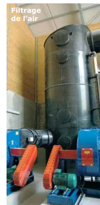
Filtrage de l'air