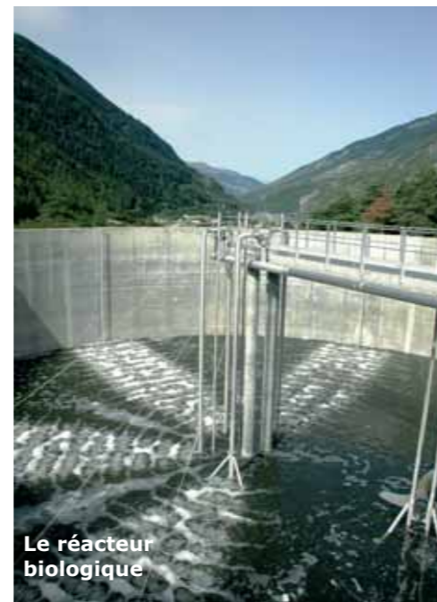
Le réacteur biologique

Les eaux usées du canton parviennent à la station d'épuration par gravitation (elles suivent la pente). Pour franchir les obstacles (l'Arc, les voies de chemin de fer), elles sont parfois "relevées", grâce à une quinzaine de pompes de relevage installées sur le parcours. Une fois arrivés à la STEP, les effluents liquides passent dans un