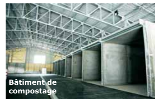
Bâtiment de compostage